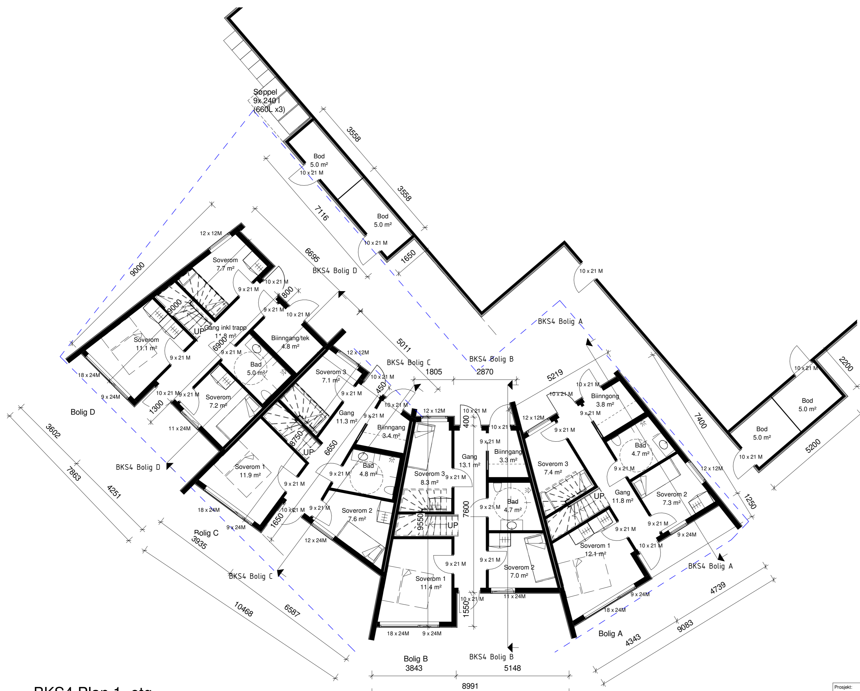
BKS4 Plan 1. etg 1 : 100